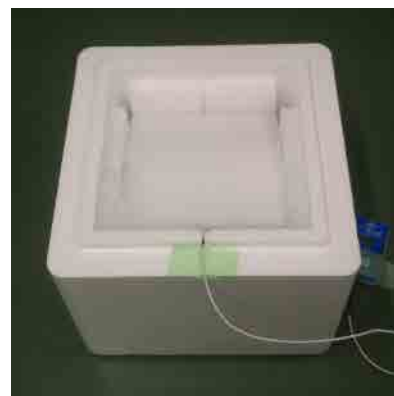
ドライアイス配置写真