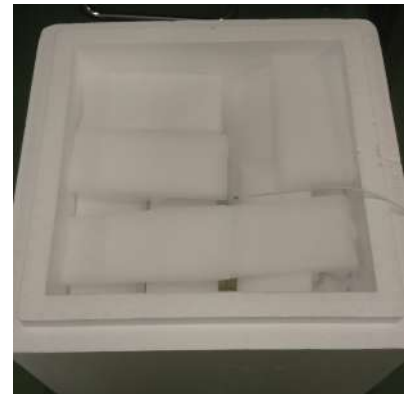
ドライアイス配置写真