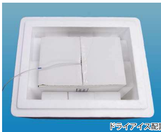
ドライアイス配置写真