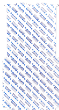
45用ジェルボックス 天地用