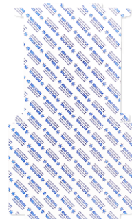
45用ジェルボックス 側面用