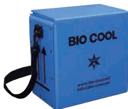
バイオクールショルダー

バイオクールは、ご要望に応じて、肩掛けショルダー加工、紐付け加工などが可能です。また、専用のラベルやキャリーベルトもございます。