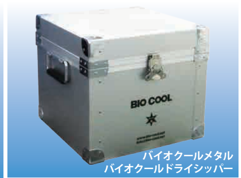
バイオクールメタル バイオクールドライシッパー