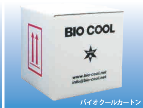
バイオクールカートン